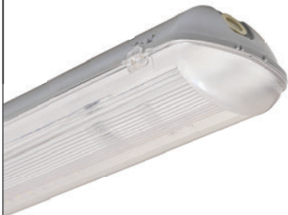
СВЕТИЛЬНИКИ С LED ЛАМПОЙ