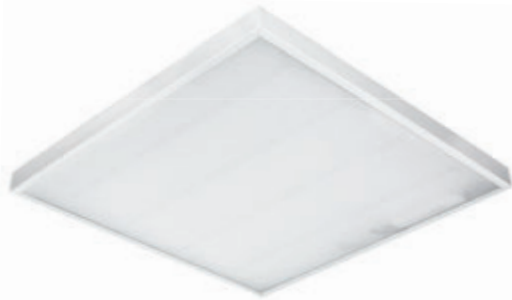
СВЕТИЛЬНИКИ С БАП