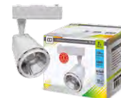
Трековый светильник LLT