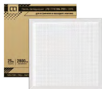
Светильники LLT LPU-ПРИЗМА и LP-PRO