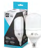
Лампа ASD LED-HP-PRO