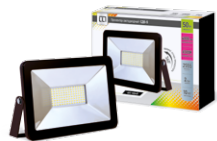
Пржекторы LLT серии СДО