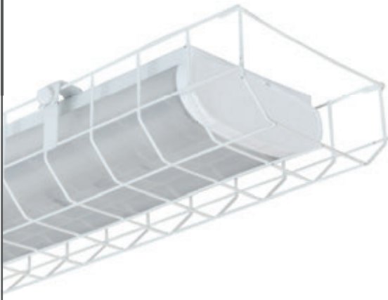
СВЕТИЛЬНИКИ ДЛЯ СПОРТЗАЛОВ